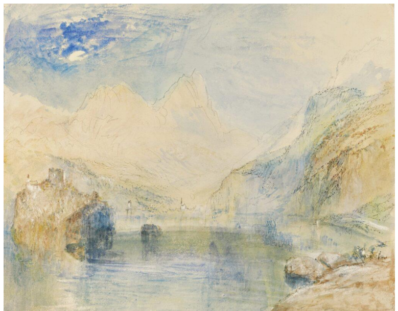
Abb.5: Die erste Version des Schwanau Aquarellbilds von William Turner. Das Bild hat heute einen Wert von einer bis eineinhalb Millionen US-Dollar.

Der englische Maler William Turner besuchte Lauerz im Jahr 1843 und malte hier ein kleines Aquarellbild von der Schwanau. Das Bild vom Lauerzersee entstand in den frühen Abendstunden, das Mondlicht beleuchtete die Bergketten und schimmerte auf der Seeoberfläche. Dieses erste Bild von der Schwanau diente Turner als Vorlage für eine zweite Version aus dem Jahr 1848. Die erste Version ist in Privatbesitz, die jüngere Version befindet sich im Victoria and Albert Museum in London.