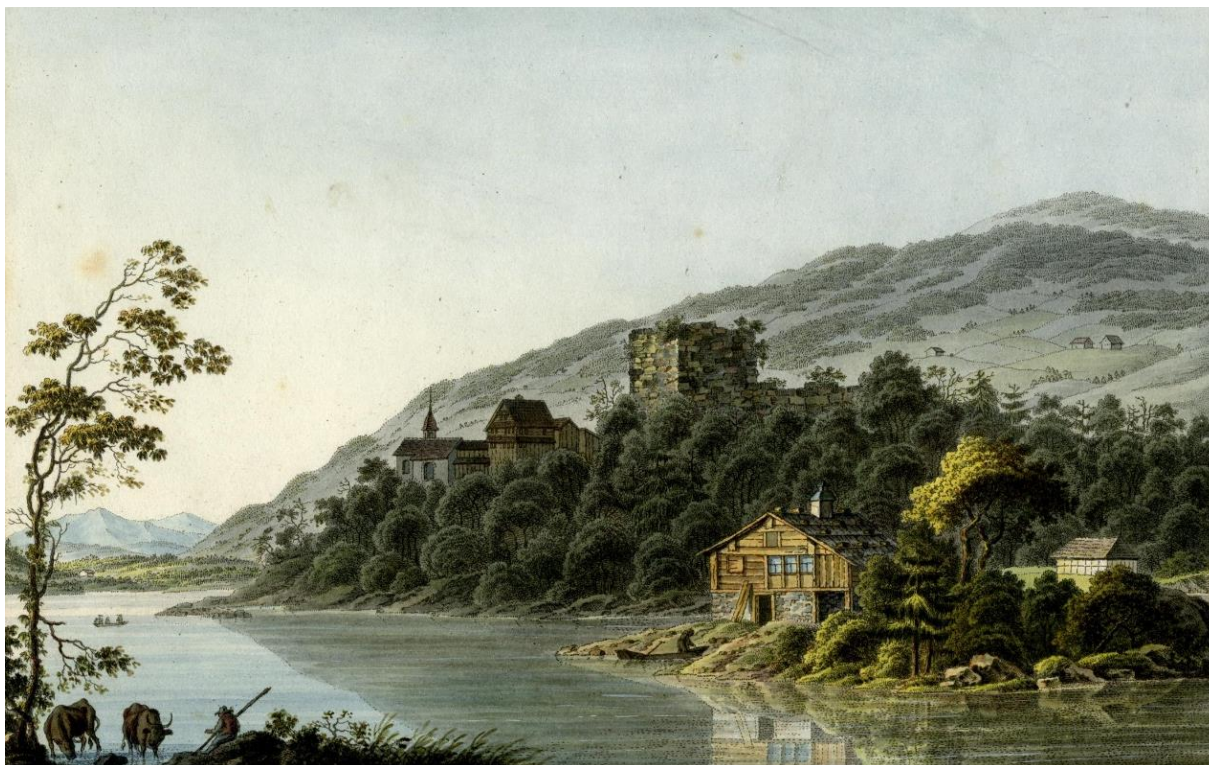
Abb. 3: Auf beiden Inseln im Lauerzersee lebten einst Waldbrüder. Das Haus auf der kleinen Insel soll bereits vor dem Bergsturz abgebrochen und das Bauholz in einem Lauerzer Haus verbaut worden sein.