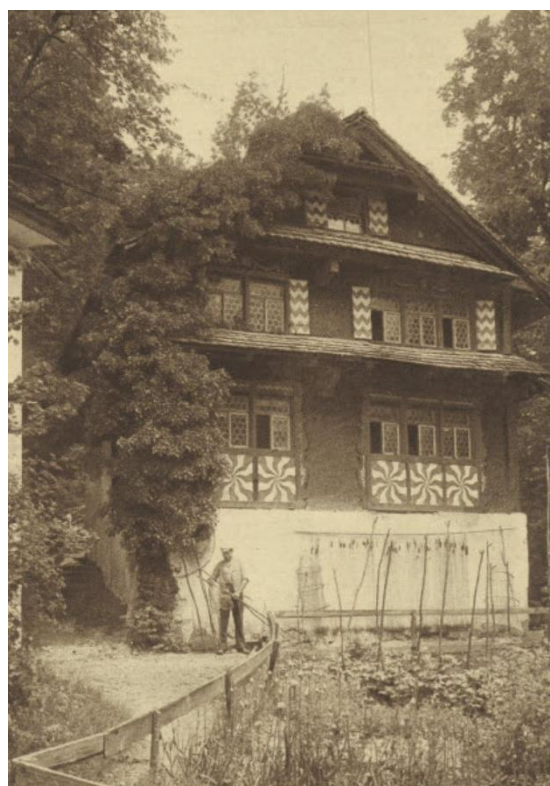
Abb.4: Das Fischerhaus auf der Schwanau um 1900. An der Hausmauer stehen diverse Fischerei-Utensilien. Davor liegt ein Pflanzgarten mit Gemüse und Blumen.

Mit dem Ende des Ancien Régime gelangte die Insel vom Alten Land Schwyz an die Kirchgemeinde Schwyz. Wegen Geldnot verkaufte am 29. Oktober 1808 der Kirchenrat die beiden Inseln an General und Landeshauptmann Ludwig Auf der Maur (1779 - 1836). 36 Jedoch unter den Bedingungen, dass er die Kapelle wieder aufbaut, eine Jahrzeitstiftung einrichtet, die Burgruine erhält und ihm das Verkaufsverbot an Nichtlandleute auferlegt wird. 37 Dieser Louis Auf der Maur stand als Offizier in spanischem, neapolitanischem und später in holländischem Solddienst. 38 Er nannte sich fortan „Ritter von Schwanau“ und führte zwei Schwäne in seinem Wappen. Auf der Maur liess die neue Kapelle am heutigen Standort erbauen und das Eremitenhaus erneuern. Am 23. August 1809 veranstaltete er ein grosses Fest mit einem eigens bemalten Schiff, Musik, Tanz, Schiessen und einem Militärmanöver. Der Schwyzer Pfarrer Fassbind bemerkte dazu lakonisch: „Die alten Adelszeiten schienen aufzuleben“. 39