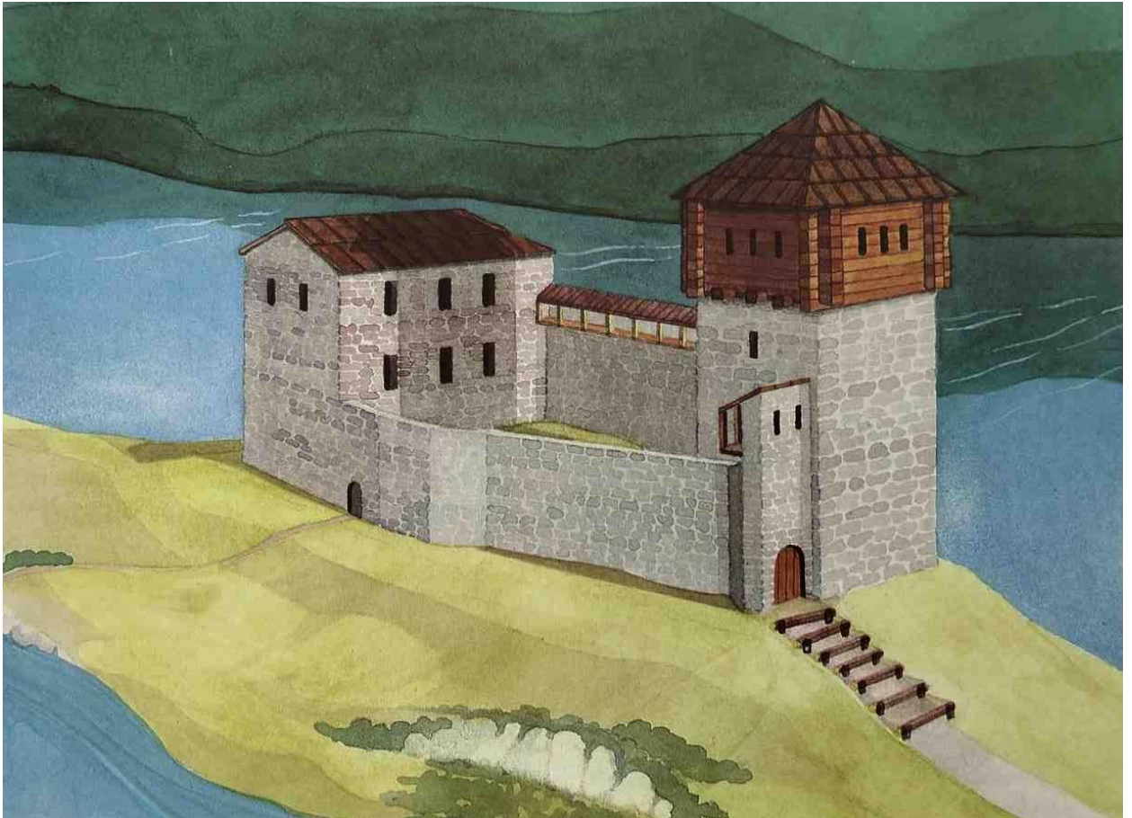
Abb. 2: Rekonstruktionsversuch der ehemaligen Burg Schwanau. Gut zu erkennen sind das Tor, der hölzerne Aufbau des Turms, die Licht- oder Schiesscharte am Turm, der steinerne Palas und das Pförtchen in der Nordmauer. Grafik: 1291 – Die Geschichte, Silva-Verlag, Zürich, 1990