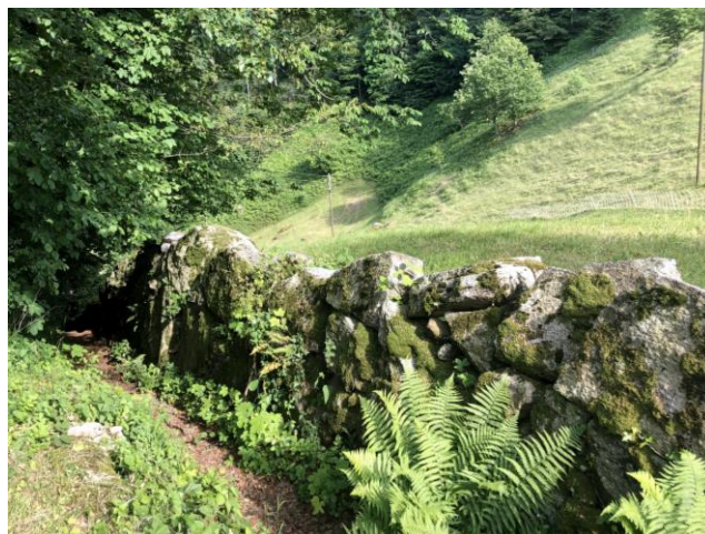
Abb. 2: Mauerreste im Ottental am alten Weg nach Seewen. Dieser Wegabschnitt wird von Einheimischen auch "Gass" genannt.

Im Jahr 1340 kommt dem Wegstück zwischen Lauerz und Seewen eine stärkere Bedeutung zu. Von der Landsgemeinde Schwyz wird einem Weganstösser namens Bruster die Anweisung erteilt, dass er den Weg von Seewen bis zu einer Weggabelung (vermutlich im Otten) in Stand halten müsse und der Weg an der engsten Stelle (vermutlich unterhalb Zingel) so breit zu erhalten sei, dass dort ein Pferd mit zwei beidseitig beladenen Holzfässern Platz haben soll. 16 Wir erkennen daraus, dass bereits im Mittelalter der Weg nach Seewen kein reiner Fussweg mehr war, sondern als Saumweg für den Warentransport benutzt wurde. Die Lauerzerseestrasse hatte vermutlich für die Schwyzer verschiedene Funktionen. Einerseits war sie die kürzeste Verbindung ins jüngst schwyzerisch gewordene Arth. Andererseits diente sie offensichtlich als Transportweg für Güter aus dem Westen (Zug, Aargau etc.). Zudem wurde sie möglicherweise als Teil einer alternativen Gotthardroute genutzt, die als „Absicherung“ zur Gotthardroute über den Vierwaldstättersee fungierte. Falls in Luzern oder Küsnacht keine Schiffe nach Brunnen verkehren konnten, war immerhin der Saumweg über Arth und Lauerz nach Brunnen für den Verkehr passierbar. Die Lauerzerseestrasse nannte man bis ins 20. Jahrhundert hinein Gotthardstrasse. Mauerreste des ehemaligen Weges nach Seewen finden sich heute noch im Ottental (siehe Foto).