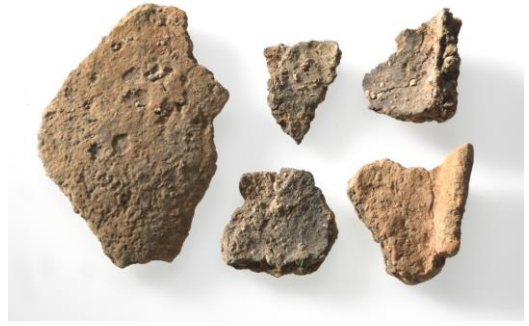
Abb. 1 Bronzezeitliche Keramikscherben von der Insel Schwanau.

Während einer archäologischen Ausgrabung auf der Schwanau im Jahr 1960 wurden einige Gegenstände aus römischer und urgeschichtlicher Zeit gefunden. Namentlich kamen Keramikscherben aus der Bronzezeit 1 (zirka 1200 Jahre vor Christus) und der Römerzeit zum Vorschein. Somit waren bereits vor mehr als 3'000 Jahren Menschen auf dem heutigen Lauerzer Gemeindegebiet anwesend.