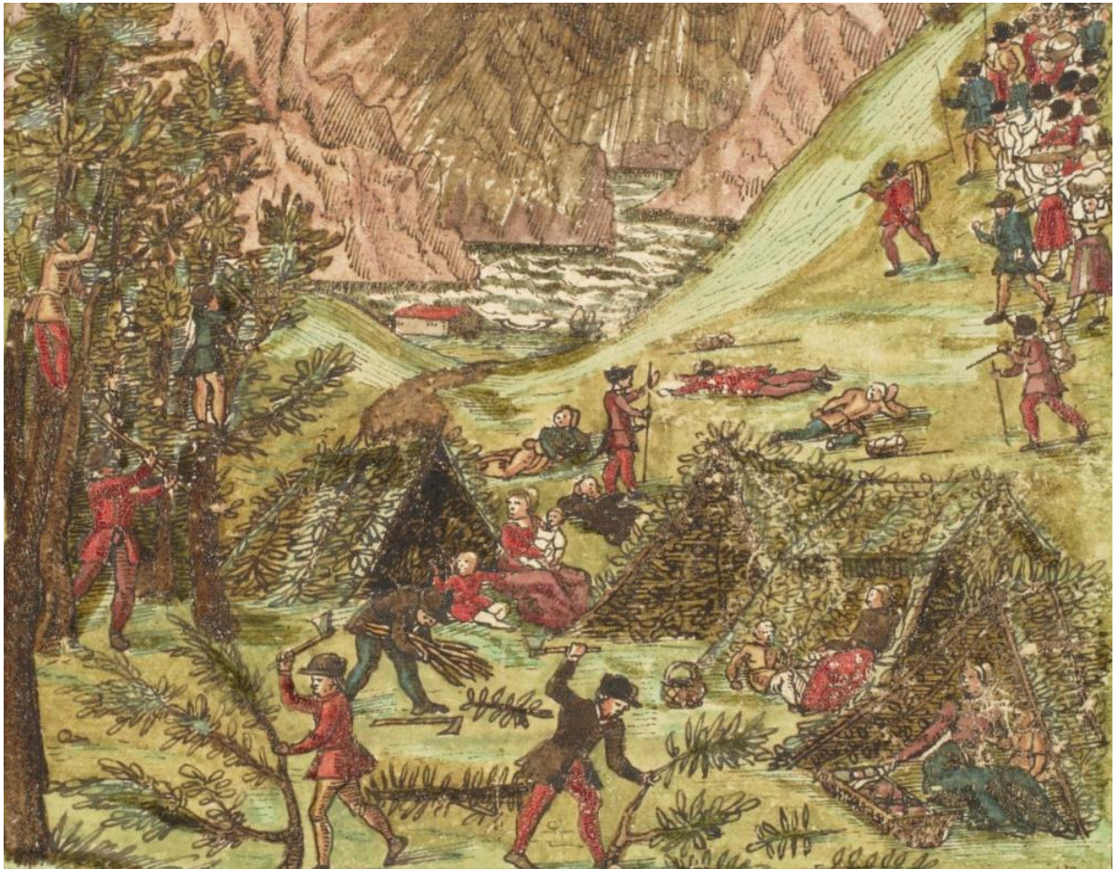
Abb. 2: Der Landesausbau der Alemannen in Schwyz, wie man ihn sich Jahrhunderte später vorstellte. Gut zu erkennen sind die Holzfäller mit ihren Äxten im Vordergrund. Dahinter der Urnersee und rechts eine neu ankommende Gruppe von Siedlern.

Die Rodungstätigkeit um den Lauerzersee nahm bis Mitte des 12. Jahrhunderts zu. Um ca. 1150 – 1200 war der Wald so stark zurückgedrängt, wie nie zuvor in unserer Geschichte. Spätestens um 1200 war somit die Urbarisierung um den Lauerzersee beendet. Das Gesicht unserer Landschaft wandelte sich bis um 1900 nur noch wenig. Mit dem Zeitalter der Moderne begann jedoch ein neues Kapitel, in dem der Wald wieder zunimmt. Der Waldbestand ist heute in Lauerz grösser als noch vor einigen Jahrzehnten. Die Grundstücke Unter Gurgun, Ottenfang und Oberberg, ehemals landwirtschaftlich genutzt, sind heute von Wald bedeckt. Auch auf der Alp Ober Gurgun hat der Wald wieder zugenommen.